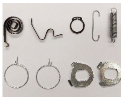
S-33000290 Zubehör-Set / Federn